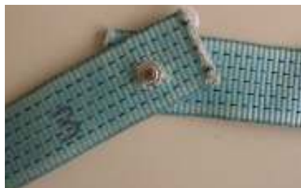
Abb. 23: „Verschraubte“ Gurtbänder