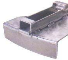
Abb. 25: Kantenschoner

Rutschhemmendes Material (Antirutschmatten) ist als Kantenschutz (Kantenschoner) nicht geeignet!