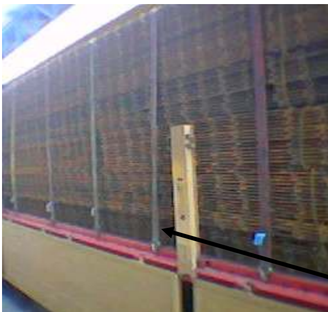
Abb. 19: Fehlendes Etikett