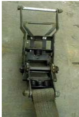
Abb. 13: Verformtes Spannelement

Beispiele für ablegereife Zurrgurte, verursacht durch beschädigte Spannelemente