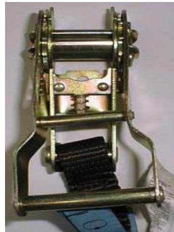
Abb. 14: Verformtes Spannelement