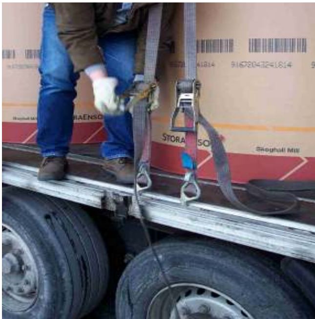
Abb. 18: Fehlendes Etikett