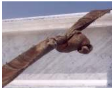
Abb. 21: Verlängerung durch Knoten