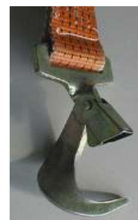
Abb. 17: Aufweitung