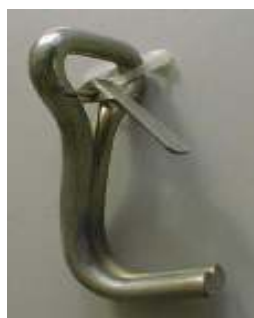
Abb. 16: Aufweitung