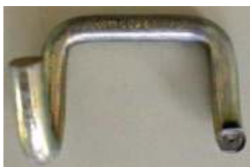
Abb. 15: Hakenbruch

Beispiele für ablegereife Zurrgurte, verursacht durch beschädigte Verbindungselemente: