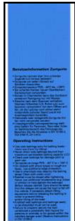
Abb. 20: Etikett nach EN 12195-2