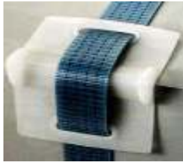
Abb. 24: Kantenschoner

Zurrgurte sind empfindlich gegen scharfe Kanten. Bei scharfkantigen Ladegütern müssen geeignete Kantenschützer (Kantenschoner; Abb. 24 und 25) zum Schutz des Gurtes vor Beschädigungen eingesetzt werden. Gleichzeitig wird die Ladung geschützt und die in den Gurt eingebrachten Kräfte werden besser übertragen.