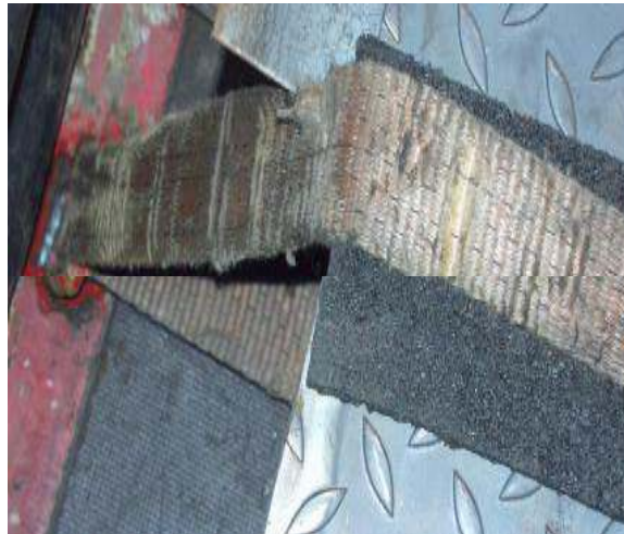
Abb. 26: Ablegereifer Gurt mit Antirutschmatte als Kantenschutz