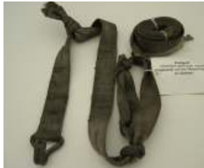
Abb. 22: Verlängerung durch Knoten

Auch sonstige mechanische Verbindungen (z. B. zur Verlängerung oder zur Reparatur) wie z. B. eine Verschraubung oder Vernietung sind nicht zulässig!